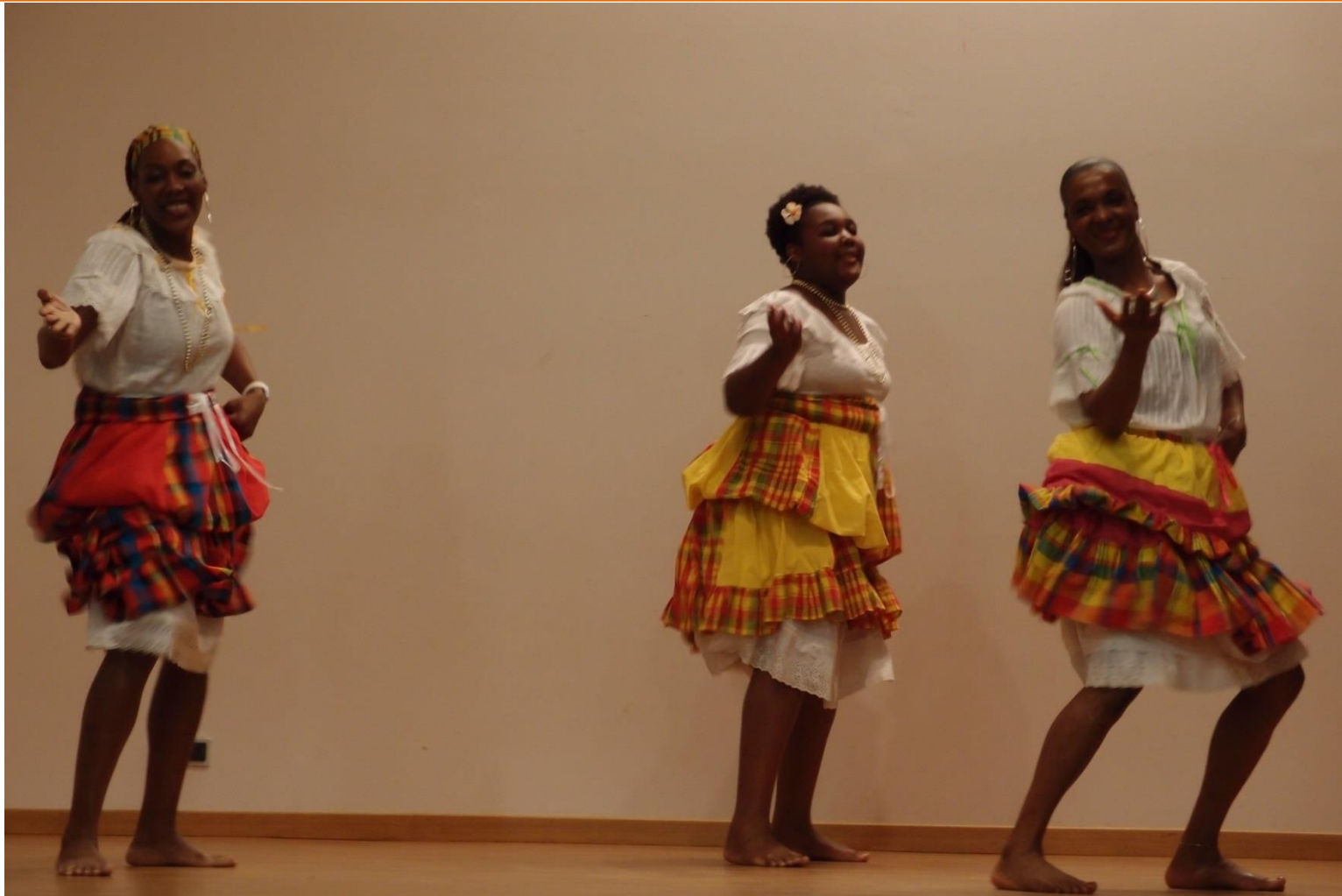
Danse « de base »