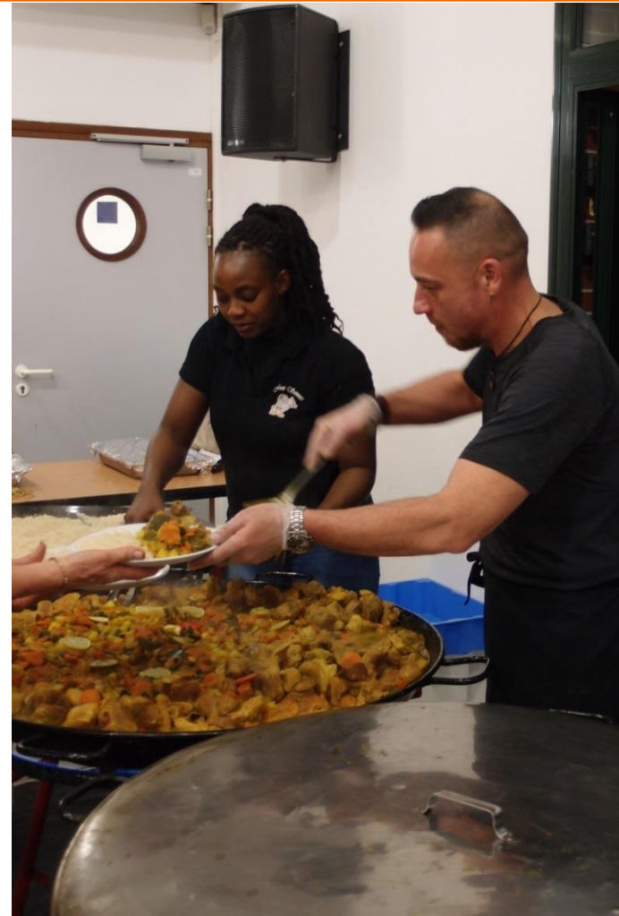
Plat traditionnel : colombo de porc